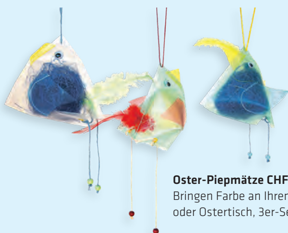
Oster-Piepmätze CHF 19.00 Bringen Farbe an Ihren Osterbaum oder Ostertisch, 3er-Set assortiert