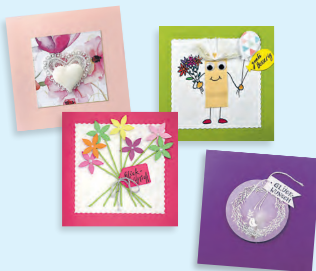
Kartenatelier Diverse Karten für Geburtstage, Hochzeit, Glückwünsche, Gute Besserung usw. zwischen CHF 5.50 und CHF 7.50