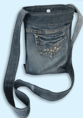
Jeans-Tasche CHF 39.00 Selbstgenähte Taschen von POA Youth, der Standortbestimmung für junge Erwachsene. Jede Tasche ein Unikat - mit Innenfutter. 24 x 35 cm