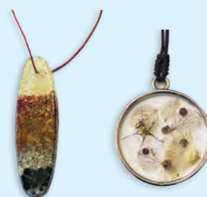
Schmuckanhänger gefertigt in unseren Trainingsarbeitsplätzen aus diversen Naturmaterialien CHF 19.00