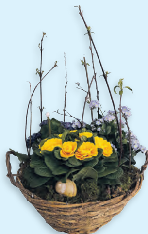
Grosse Auswahl an Frühlings- und Ostergestecken aus der Gärtnerei Wisli in Bassersdorf, CHF 10.00 bis CHF 50.00 Spezialwünsche auf Anfrage.

Weitere Produkte finden Sie unter wisli-shop.ch . bestellungen@wisli.ch