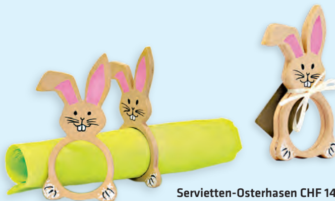
Servietten-Osterhasen CHF 14.00 Von Hand gesägt und bemalt, 2er-Set