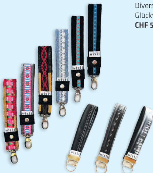
Schlüsselanhänger aus alten Stoffresten und Veloschläuchen CHF 20.00 pro Stück Jeder Anhänger ist ein Unikat.