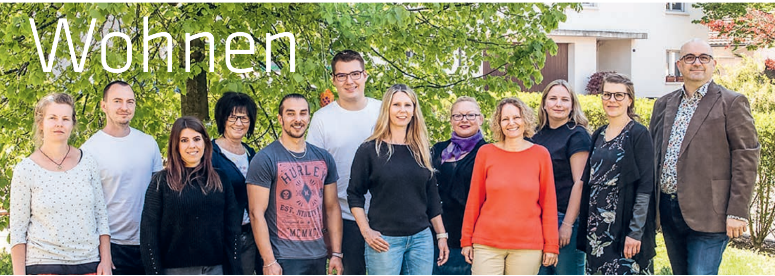
Fachteam Bereich Wohnen