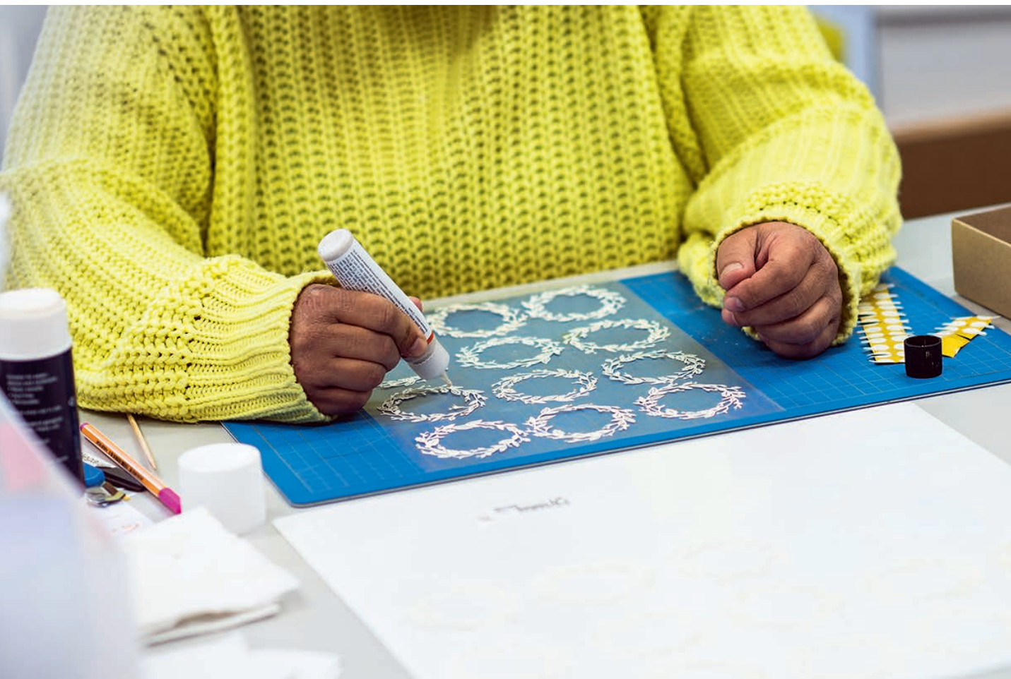
Kartenproduktion in der Tagesstätte Bülach