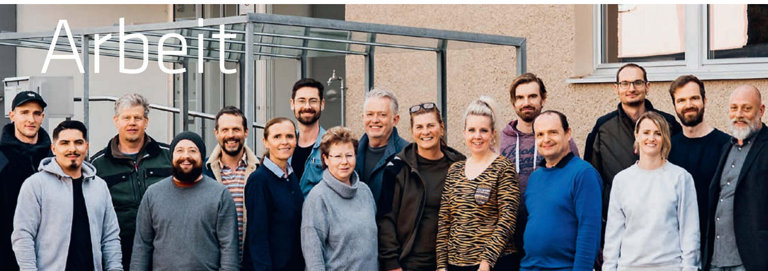
Fachteam Bereich Arbeit