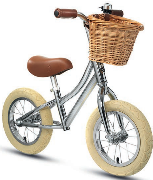
Kindervelos von Siech Cycles gehören zum Sortiment des neuen Velowerks im Glasi-Areal.