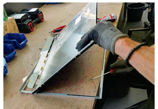
Geben ihr Inneres preis: PC-Bildschirme bei der Demontage