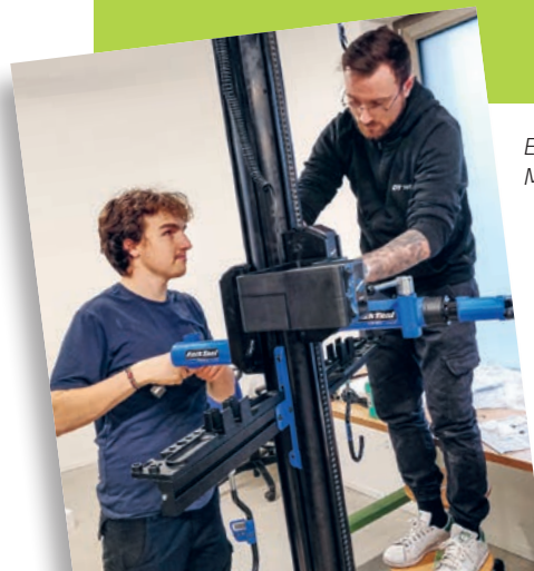
Einrichten der Montageständer

Am 27. Dezember kam der Umzugswagen und chauffierte alle Tische, Werkbänke, Schränke, Fahrradlifte und unzähliges Kleinmaterial zum Haus F im neuen Glasi-Areal. Die drei Werkräume, das neue Kleinteillager, der Showroom und der Aufenthaltsraum wurden mit Begeisterung vom Team der Velowerkstatt Wisli eingerichtet. So wurde den bisher kahlen Wänden Leben eingehaucht. Am 17. Januar 2023 wurden unter dem neuen Namen «Velowerk» die Ladentüren wieder geöffnet. Alle Beteiligten sind gespannt, was das neue Jahr in diesen ansprechenden Räumen bringen wird.